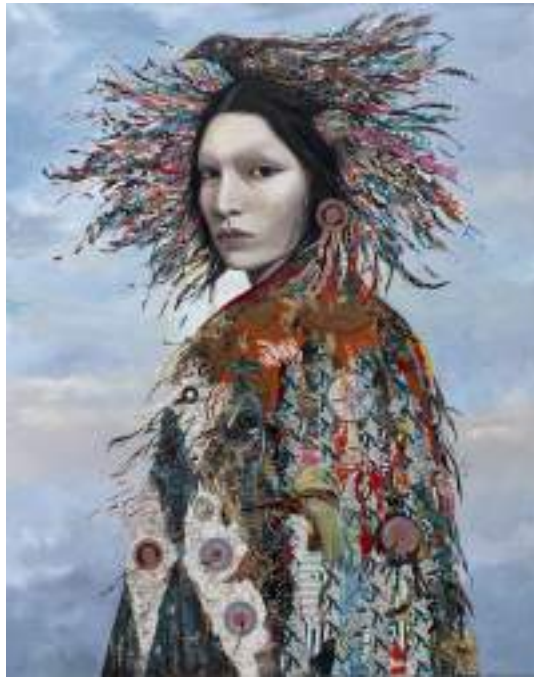
New Horizon - 2024 - 162 x 130 cm

J'avais huit œuvres roulées. C'est à ce stade que nous avons commencé à rêver ensemble du futur.