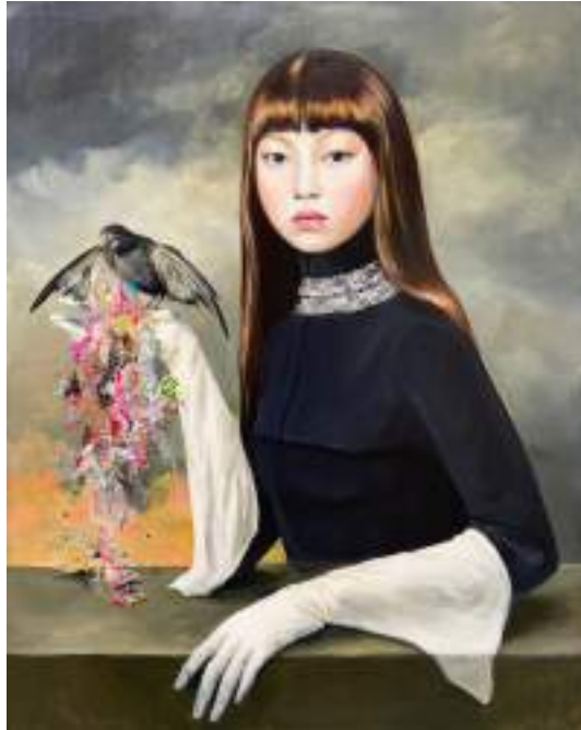
Still Life - 2023 - 162 x 130 cm

La première exposition fut organisée au salon du Luxembourg, toutes les toiles furent cédées.