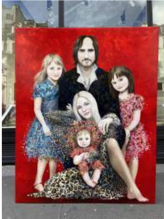
Famille Américaine - collection privée - 2022