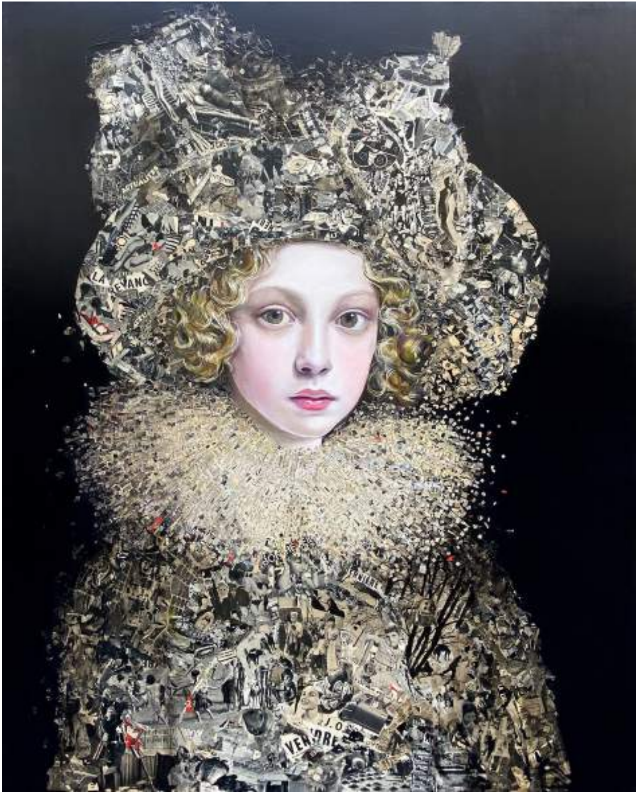
L'innocent - 2024 - 162 x 130 cm