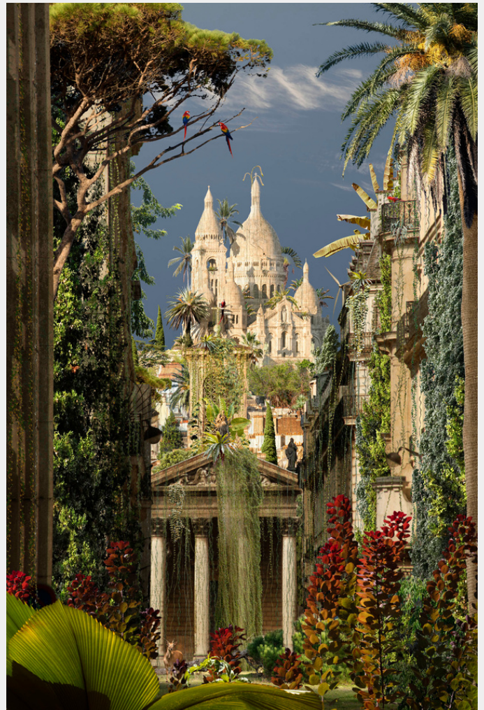
Paris, Montmartre Butte Magique - 2023 Ilford Gloss - tirages 7 ex.