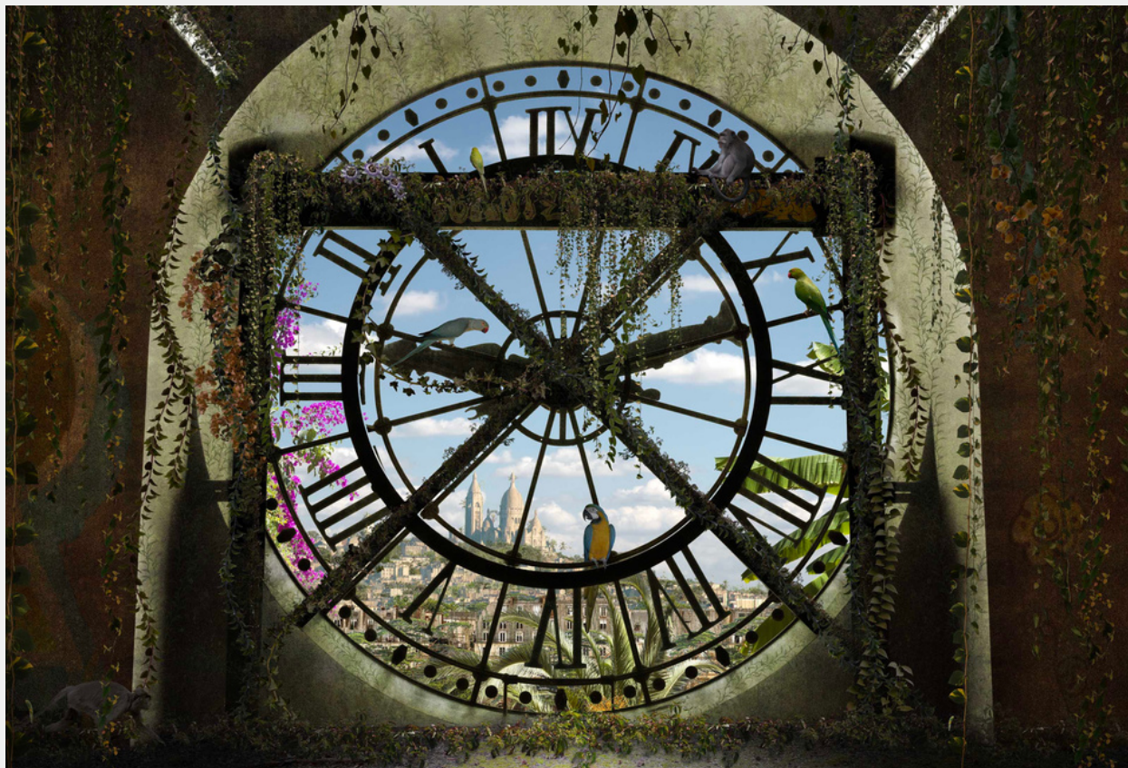
Paris, Musée Orsay Green Time - 2024 Ilford Gloss - tirages 7 ex