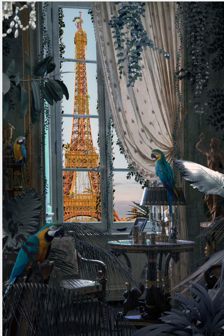
Paris, Fenêtre sur Tour - 2024 Ilford Gloss - 7 tirages - limitée 7 ex

5 rue du Grenier Saint-Lazare, 75003 Exposition du lundi 25 mars au samedi 20 avril 2024