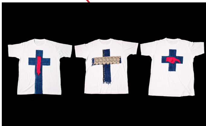
© Andres Serrano, Sans titre , 2015