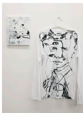
© Stéphane Calais, Heroes , 2015