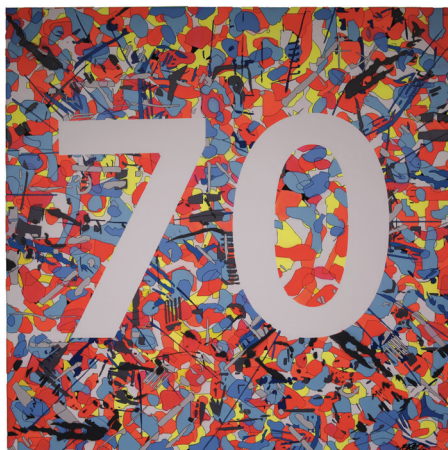
© Basto, 70 SPF , 2015