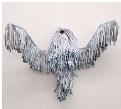
© Max Boufathal, Voodoo Doodoo , 2015