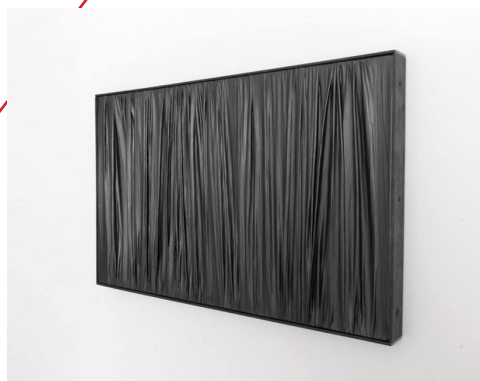
© Mathieu Bonardet, Sans titre , 2015