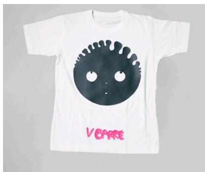
© Virginie Barré, Pour Haïti , 2015