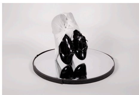
© Madeleine Berkhemer, Heels for Haïti , 2015