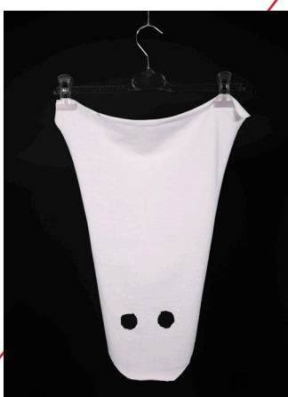
© Claude Closky, Fantôme suspendu par les pieds , 2015