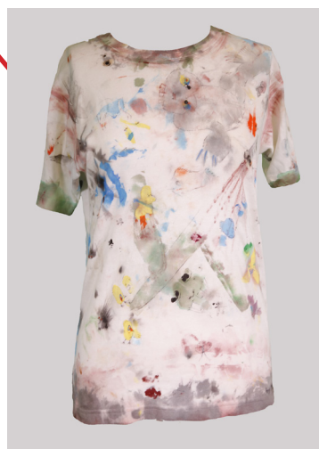
© Philippe Mayaux, Sans titre , 2015