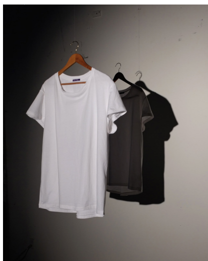
© Urs Fischer, T-Shirt Eclipse , 2015