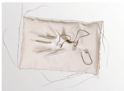
© Alexandra Lowe, Faire versus Etre , 2015