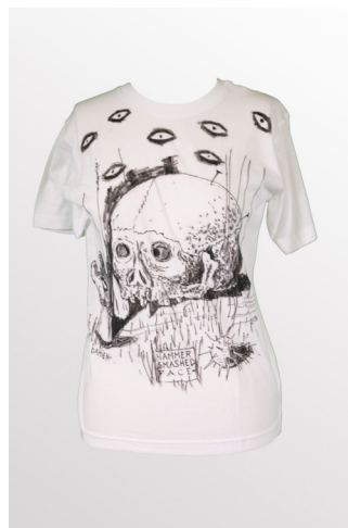
© Damien Deroubaix Hammer Smashed face , 2015