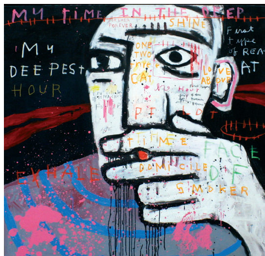
My deepest hour - 2008 - 150 x 150 cm