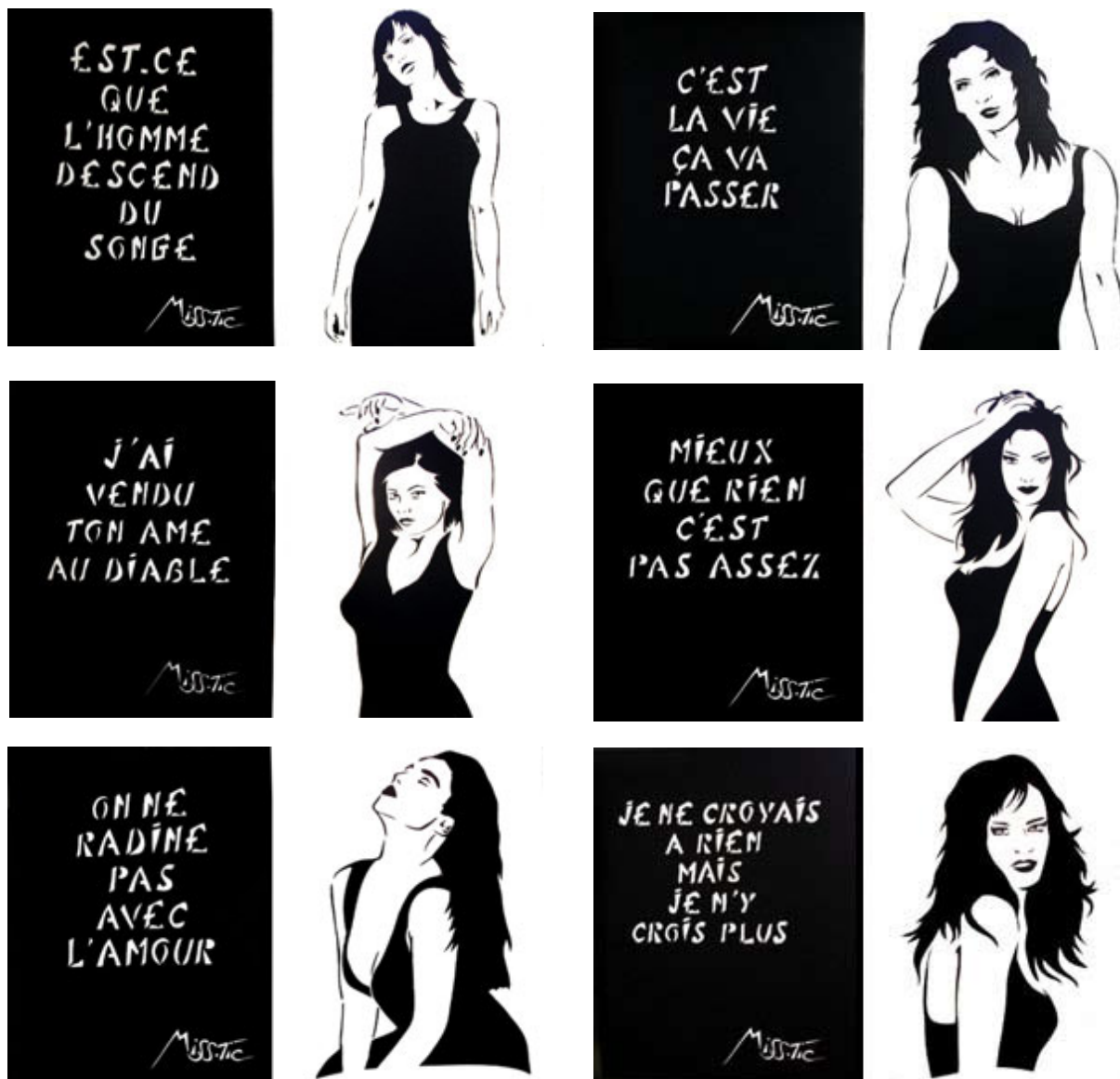
Miss.Tic - Diptyques « Je prête à rire, mais je donne à penser » - 2008 - © Galerie W

Des diptyques black & white : d'un côté une création jouée avec les mots et l'humour (sur fond noir) ; de l'autre une de ces fameuses créatures féminines qui vit, agit, aguche (sur fond blanc). Textes et images sont enfin confrontés, exposés en vingt-deux diptyques - soit quarante-quatre pochoirs originaux - de cinq formats. Ces œuvres confirment la puissance artistique d'un travail d'esprit et contemporain, qui trouve sa place à la Galerie W.