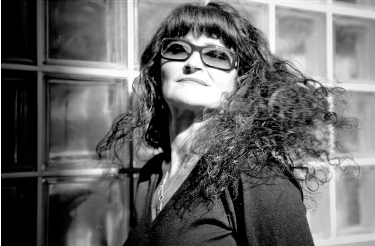
Miss.Tic - 2008 - © Galerie W

L'exposition « Je prête à rire mais je donne à penser » illustre grandeur nature des citations parues dans son livre éponyme aux Editions Grasset. De format 16 x 10,5 cm, « Je prête à rire mais je donne à penser » présente plus d'une centaine de citations.