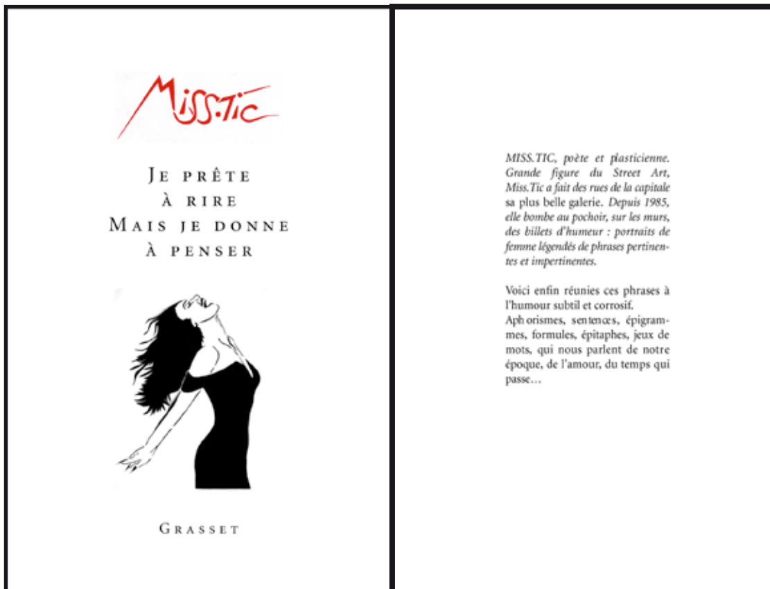
Miss.Tic - Couvertures de son livre « Je prête à rire, mais je donne à penser » - 2008 - © Editions Grasset

L'exposition « Je prête à rire mais je donne à penser » illustre grandeur nature des citations parues dans son livre éponyme aux Editions Grasset. De format 16 x 10,5 cm, « Je prête à rire mais je donne à penser » présente plus d'une centaine de citations.