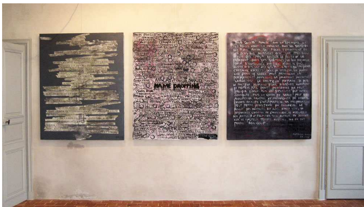
Accrochage des œuvres de Denis Robert au Festival du Mot - 2009 - ©GalerieW

Il présente une vingtaine d'œuvres au FESTIVAL DU MOT. Des mixtes sur toiles mêlant écritures, peintures, dessins sur listings informatiques Clearstream. Des toiles simples et fortes. Humaines, intimes, à la fois réfléchies et spontanées. En prise directe avec le regard et/ou qui se focalisent sur un concept et donnent à dire. La matière de Denis Robert, ce sont les mots. Une force sans équivoque. L'artiste énonce une vision, annonce un courant, celui de la transformation de l'écriture en message plastique sans retenue à la portée du regard du monde.